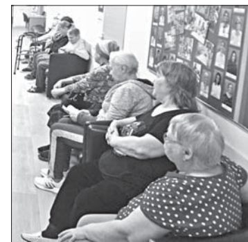
Департамент экономического развития администрации города Нижневартовска.

Добавим, что жители города для получения консультаций по вопросам защиты прав потребителей могут обратиться в департамент экономического развития администрации города по телефонам: 8 (3466) 27-15-60 и 27-25-80. Часы приёма для получения консультации с понедельника по четверг с 9.00 до 17.00, перерыв с 13.00 до 14.00.